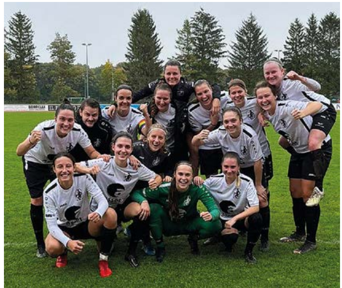
Die Bayernliga-Fußballerinnen vom TSV Schwaben nach dem 3:0-Heimsieg gegen Germania Ebing.