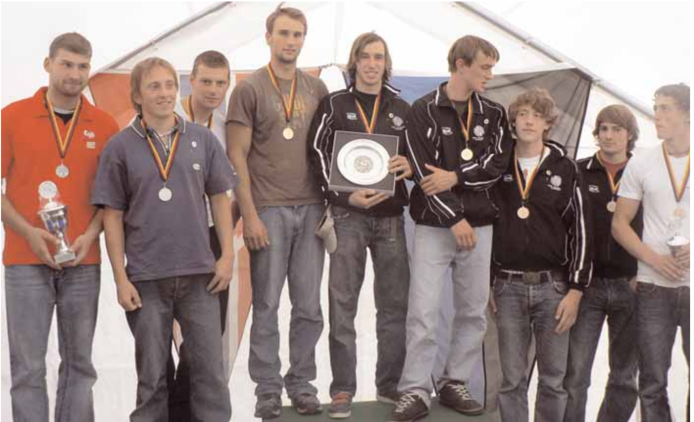
Herrenmannschaften belegen die Plätze eins bis drei

Deutsche Meister wurden bei Canadier Einer Herren: