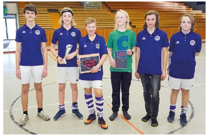
1. Platz für die Knaben A-Mannschaft

Leider mussten kurzfristig einige Mannschaften wegen der aufkommenden Corona-Pandemie ihre Teilnahme absagen.