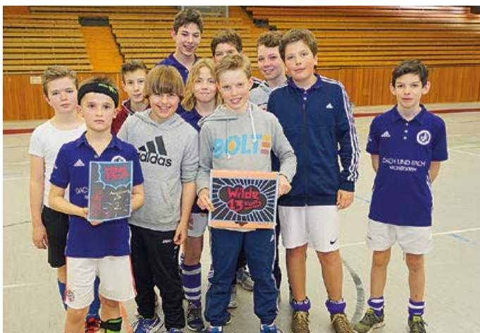
2. Platz für die Knaben B-Mannschaft