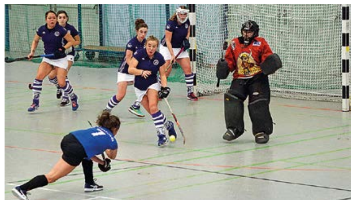
Kurze Ecke gegen Schwaben Augsburg