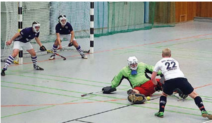
Torwart wehrt die Kurze Ecke ab