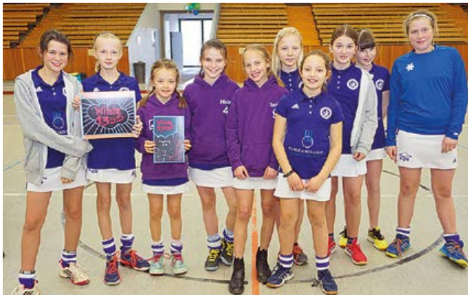
2. Platz für die Mädchen A-Mannschaft

Zum Zweitenmal organisierten unsere Eltern, Jugendtrainer*innen und Jugendbetreuer*innen den „WILDE13-CUP“ in der Augsburg Erhard-Wunderlich-Sporthalle: