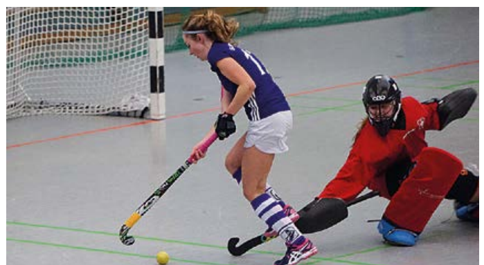
Torwart souverän ausgespielt