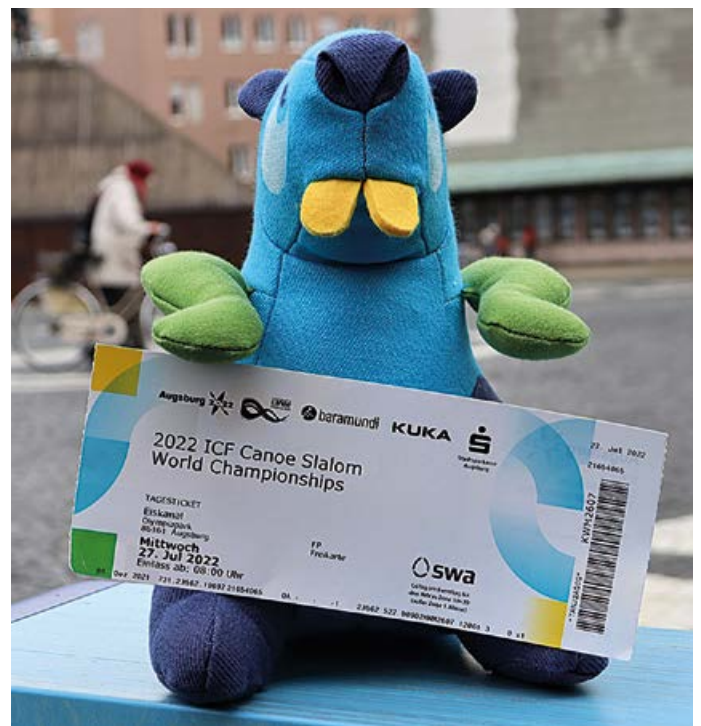
Gustl mit Ticket für die WM 2022

Die Tickets können auf der WM Plattform erworben werden. Die Vorfreude auch der beiden Nationalkanuten Elena Lilik und Sideris Tasiadis ist natürlich groß, eine Heim Kanuslalom WM hatte Augsburg zum letzten Mal im Jahr 2003, das ist schon fast wieder 20 Jahre her. Momentan wird das Gelände am berühmten Eiskanal für die anstehende WM saniert und aufbereitet.