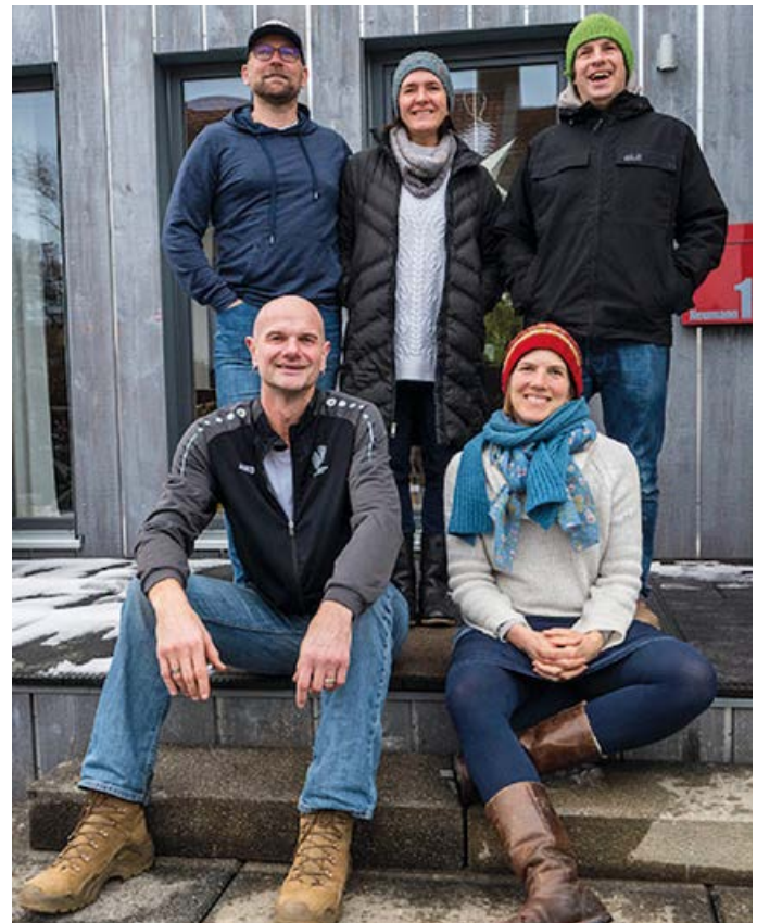
Team der Jugendwartin

Obwohl Corona, habt ihr im vergangenen Jahr bereits einiges auf die Beine gestellt. Was steht für 2022 auf der Agenda?