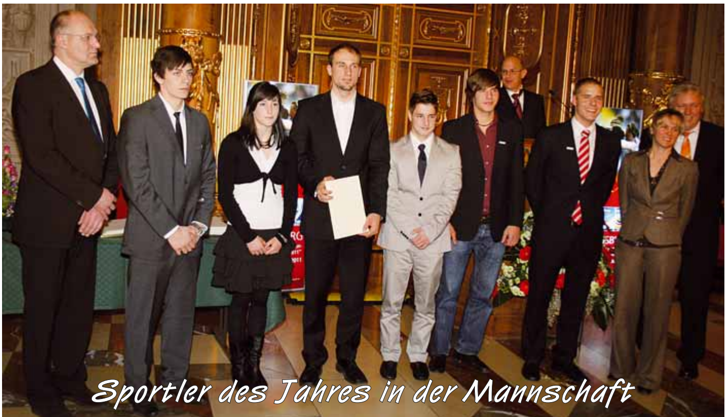
Sportler des Jahres in der Mannschaft